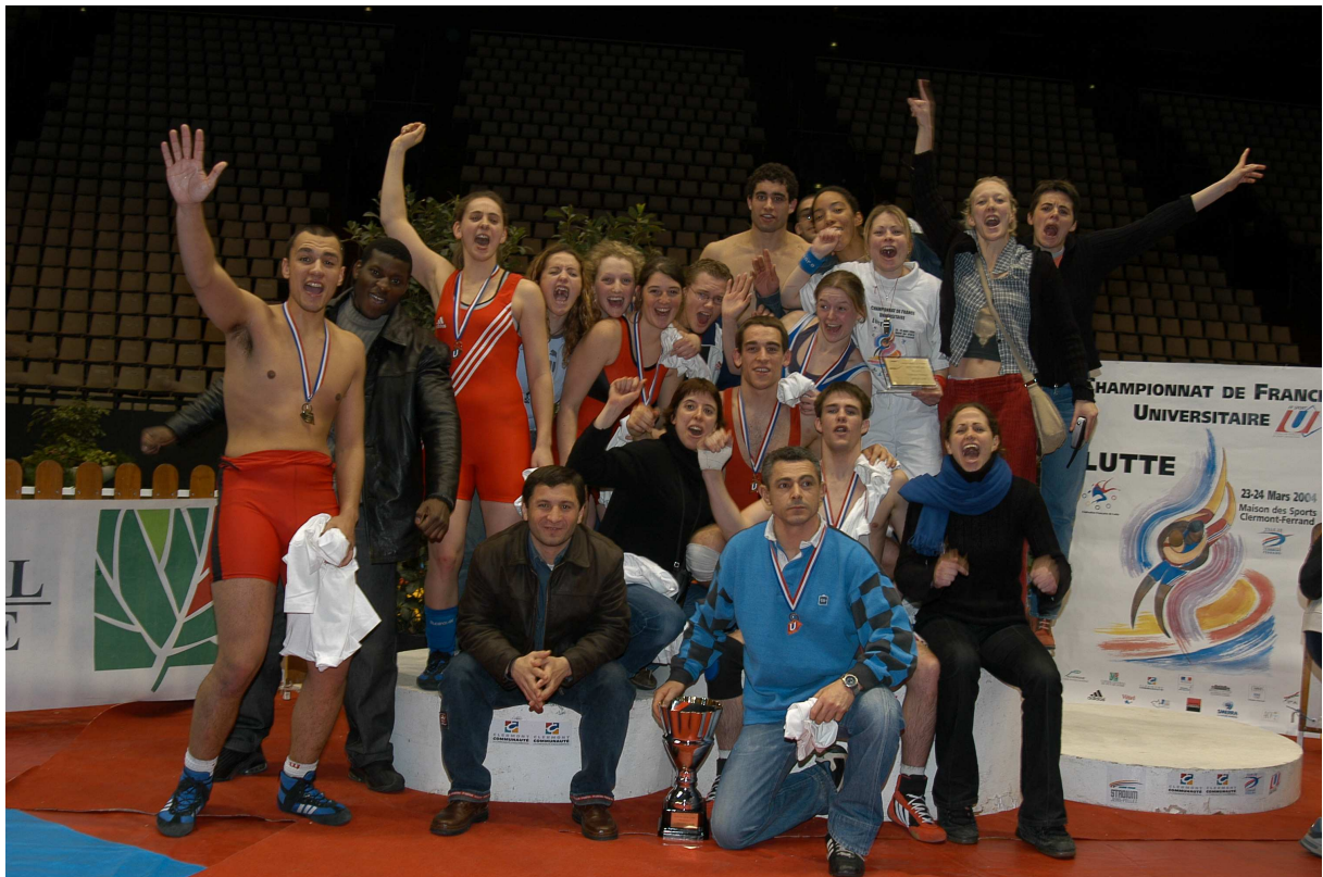
Cliché « HORS LIMITE PHOTOS » CLERMONT-FERRAND Partenaire du Sport U Auvergne